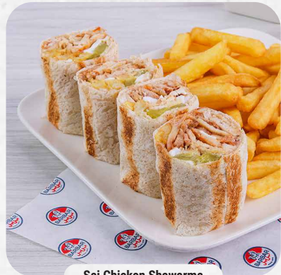
Saj Chicken Shawarma

You can choose between baked potato or french fries.