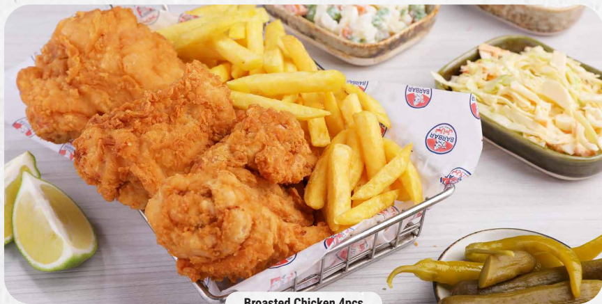
Broasted Chicken 4pcs

Fried pieces of half chicken served with cucumber pickles, salad coleslaw, Russian salad, baked potato or French fries and toum.