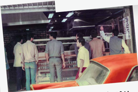
Barbar, Hamra, Beirut - 1980