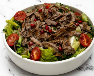
Beef Shawarma Salad