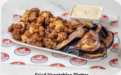
Fried Vegetables Platter

كل الأصناف تقدم مع تشكيلة من المخلل All items are served with an assortment of pickles.