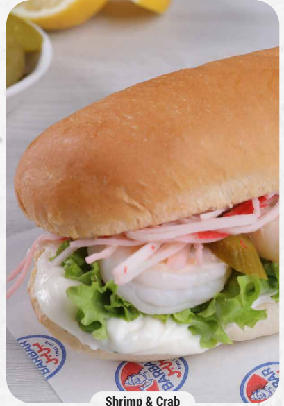
Shrimp & Crab

Shrimp 511 cal | ✳️133 Min 📊2,375.9 Mg قريدس مع مخلل الخيار والخس وصلصة التارتار وصلصة الكوكتيل تقدم بخبز السابمارين. Shrimps with cucumber pickles, romaine lettuce, tartar sauce and cocktail sauce, served in submarine bread.