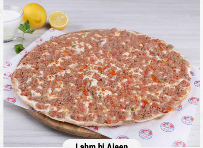
Lahm bi Ajeen