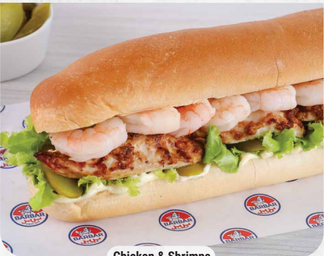
Chicken & Shrimps