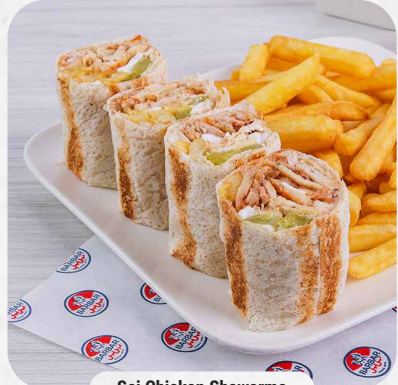
Saj Chicken Shawarma

يمكنكم الاختيار بين البطاطا المشوية أو البطاطا المقليّة You can choose between baked potato or french fries.