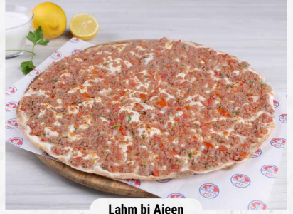
Lahm bi Ajeen