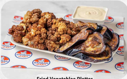
Fried Vegetables Platter

كل الأصناف تقدم مع تشكيلة من المخلل All items are served with an assortment of pickles.