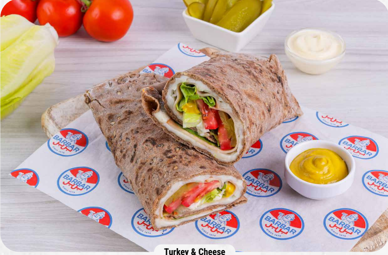
Turkey & Cheese