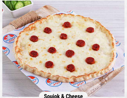
Soujok & Cheese