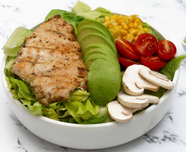
Chicken Avocado Salad