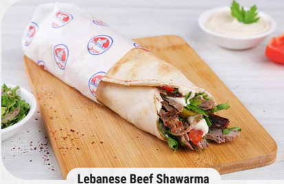
Lebanese Beef Shawarma

شاورما دجاج مقدمة بخبزنا الطازج مع مخلل خيار وبطاطا توم. Chicken shawarma served in homemade bread with cucumber pickles, fries, and toum.