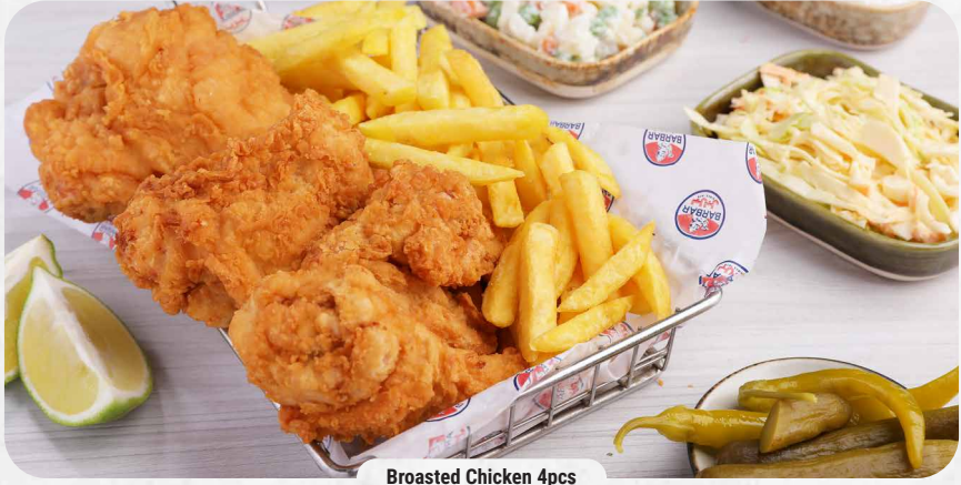
Broasted Chicken 4pcs

فروج كامل مقطع ومقلي. يقدم مع مخلل الخيار وسلطة الملفوف، والسلطة الروسية والبطاطا المقلية وصلصة الثوم. Fried pieces of half chicken served with cucumber pickles, salad coleslaw, Russian salad, baked potato or French fries and toum.