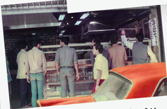
Barbar, Hamra, Beirut - 1980