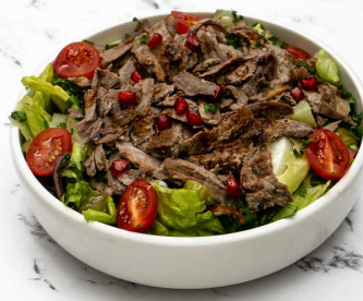
Beef Shawarma Salad