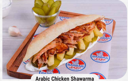
Arabic Chicken Shawarma