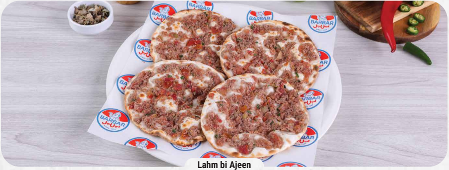
Lahm bi Ajeen

عجينة محشوة باللحم المفروم والبصل والتوابل House made dough stuffed with meat, onion, and spices.