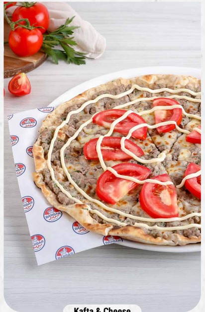
Kafta & Cheese