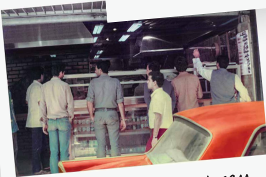
Barbar, Hamra, Beirut - 1980