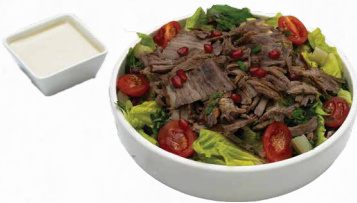
سلطة شاورما لحم

للمزيد من المعلومات يرجى الاطلاع على صفحة السلطات.