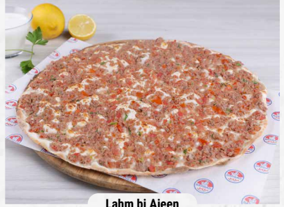
Lahm bi Ajeen