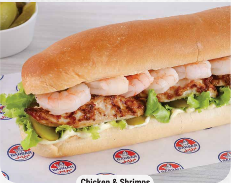
Chicken & Shrimps