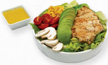
سلطة الدجاج والأفوكادو