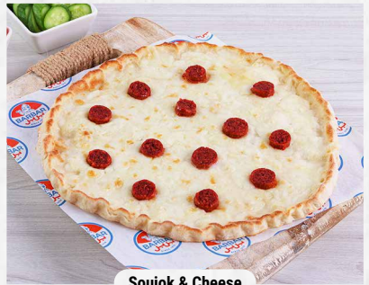
Soujok & Cheese