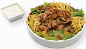
سلطة شاورما دجاج