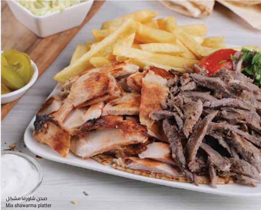
صحن شاورما مشكل Mix shawarma platter

نصف الكمية من شاورما الدجاج ونصف الكمية من شاورما اللحمة مع مخلل الخيار والبيواز والبنندورة المشوية وسلطة الملفوف والسلطة الروسية والبطاطا والطرطور والثوم Half portion of chicken shawarma and half portion of beef shawarma, served with cucumber pickles, biwaz, grilled tomato, coleslaw, Russian salad, fries, tarator sauce and toum