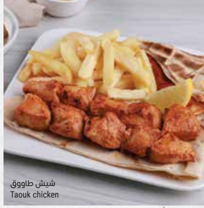
شيش طاووق Taouk chicken

٢ شيش لحم مفروم بالخضار والتوابل. يقدم مع الفلفل الحار والبندورة والخبز الحر 2 skewers of ground meat mixed with vegetables and spices, served with chili peppers, tomato and antakli bread