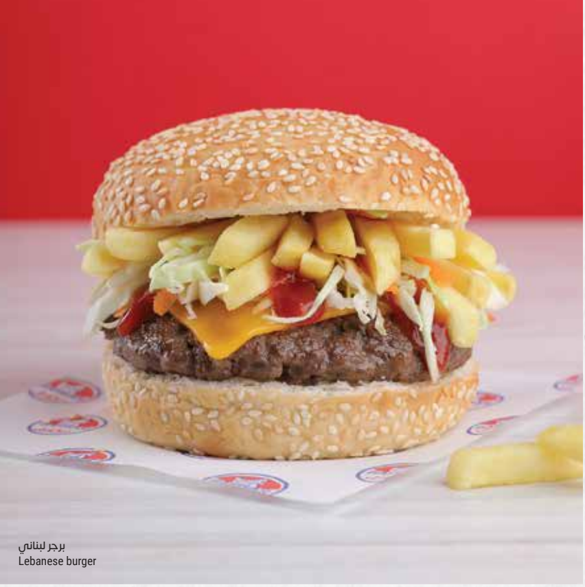
برجر لبناني Lebanese burger