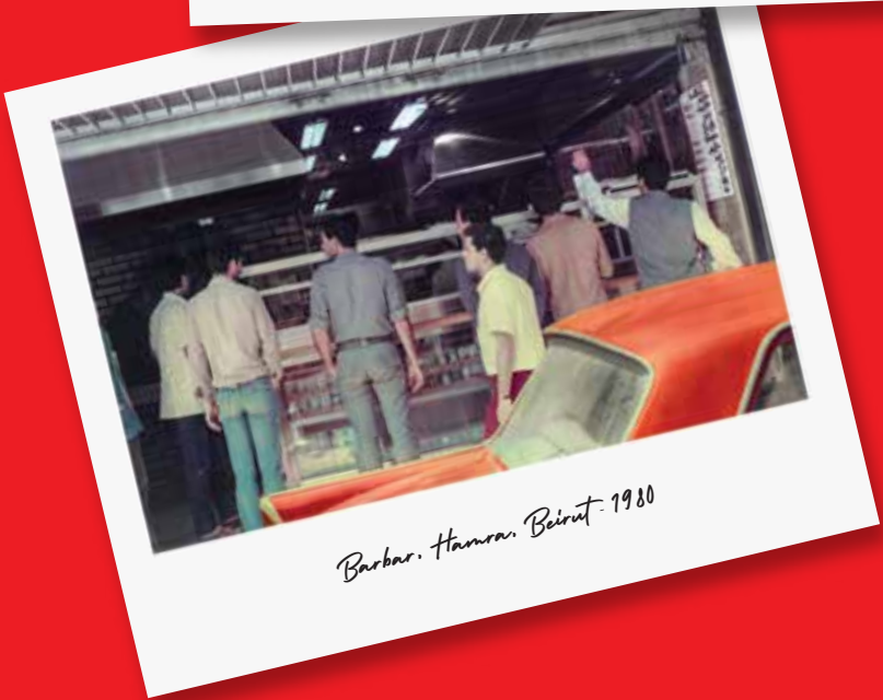
Barbar. Hamra. Beirut 1980