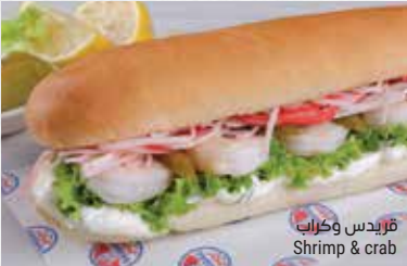
قريدس وكراب Shrimp & crab

وصلصة الكوكتيل. تقدم بخبز السابمارين Shrimps with cucumber pickles, romaine lettuce, tartar sauce and cocktail sauce, served in submarine bread