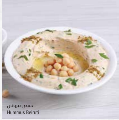
حمص بيروتى Hummus Beiruti

باذنجان مقليّ يقدم مع عصير الليمون Fried eggplant served with lemon juice