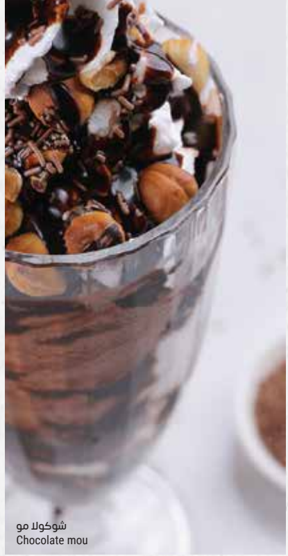
شوكولا مو Chocolate mou

ميري كريمة الشوكولا بالحليب مع البنديق وصلصة الشوكولا Chocolate merry cream and milk, topped with chocolate sprinkles, hazelnut and chocolate sauce