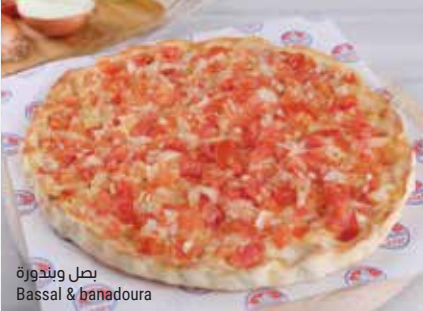
بصل وبنندورة Bassal & banadoura