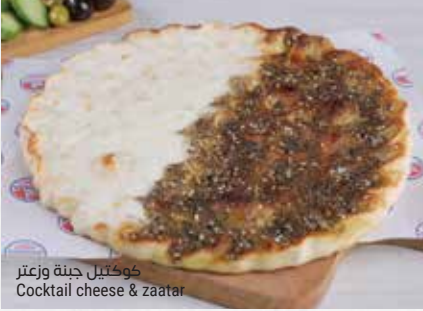
كوكتيل جبنة وزعتر Cocktail cheese & zaatar