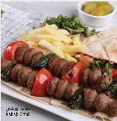
كباب أورفلي Kabab Orfali

جميع الأطباق تقدم مع البطاطا المقلية والمخلل All platters are served with a side fries and pickles