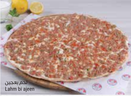
لحم بعجين Lahm bi ajeen