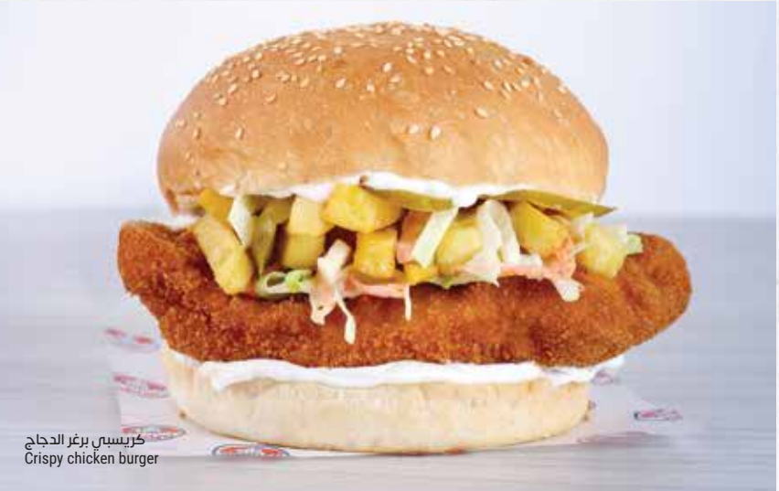
كريسبي برغر الدجاج Crispy chicken burger

صدر دجاج مقرمش مقلّي، يقدم مع مخلل الخيار وسلطة الملفوف والبطاطا والمايونيز وصلصة الثوم Fried crispy chicken breast with cucumber pickles, coleslaw, fries, mayonnaise and toum