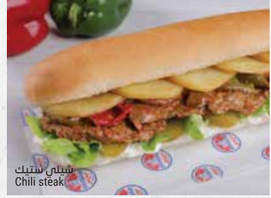
شيلي ستيك Chili steak