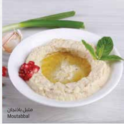
متبل باذنجان Moutabbal