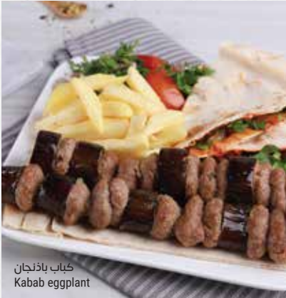
كباب باذنجان Kabab eggplant

٢ شيش كباب ١ شيش لحم، ١ شيش طاووق. يقدم مع صلصة الثوم والخبز الحر 2 kabab skewers, one beef, one tawouk chicken, served with toun and antakli bread