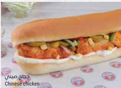
دجاج صيني Chinese chicken